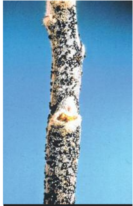
Œufs de puceron vert.

portions de deux décimètres de bois de deux ans; une cinquantaine par parcelle. Sous la loupe (de poche: grossisse-